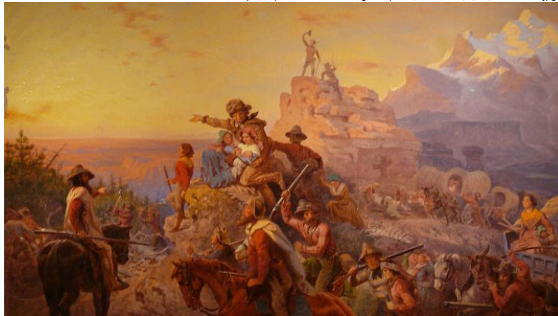
Emanuel Gottlieb Leutze: Westward the Course of Empire Takes Its Way (Ausschnitt). 1861.

https://upload.wikimedia.org/wikipedia/commons/7/72/Westward.jpg