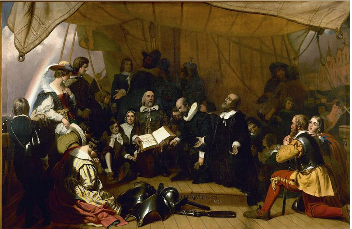
Robert W. Weir: Embarkation of the Pilgrims. 1843.

UNIVERSITÄT HEIDELBERG ZUKUNFT SEIT 1386