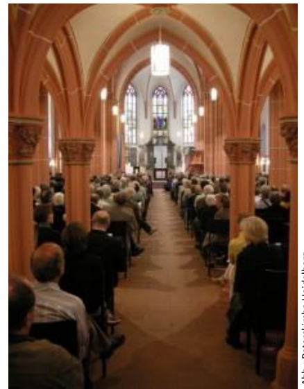
Abb.: Peterskirche Heidelberg

Das zugunsten von UNICEF gesammelte Geld soll den vom Hunger und Bürgerkrieg bedrohten Menschen im Südsudan zugutekommen.