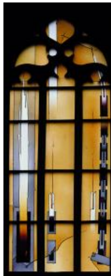
Abb.: Peterskirche Heidelberg