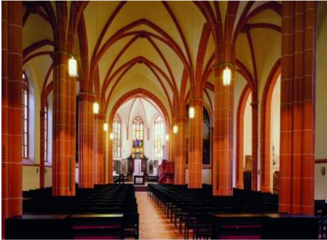
Abb.: Peterskirche Heidelberg

UNIVERSITÄT HEIDELBERG ZUKUNFT SEIT 1386