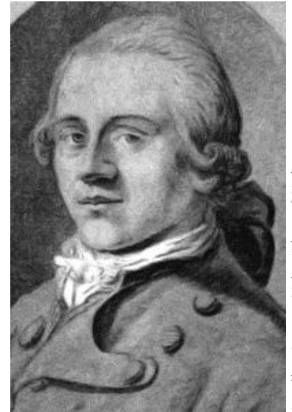
Georg Büchner (1813-1837)

https://gutenberg.spiegel.de/gutenb/autoren/bilder/lenz.jpg