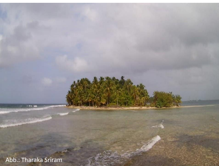
Abb.: Tharaka Sriram

Im Reisebericht geht es vor allem um die Frage, wie der Meeresschutz weltweit vorangetrieben werden kann, z.B. durch die Bildung eines globalen Netzwerkes von Meeresschutzgebieten und der stärkeren Einbindung von Kindern und Jugendlichen.