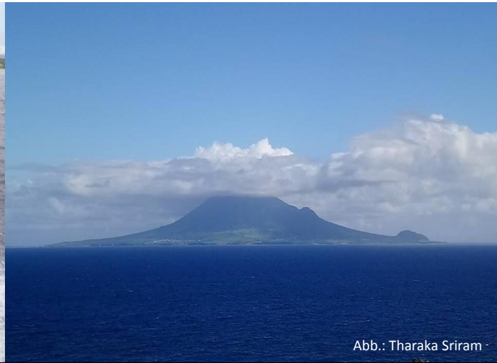
Abb.: Tharaka Sriram

Von November 2017 bis Oktober 2018 bereiste Frau Sriram 17 Länder, um Meeresschutzgebiete zu besuchen und zu lernen, wie vor Ort diese Rückzugsgebiete dazu beitragen, maritime Artenvielfalt zu bewahren.