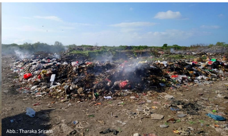
Abb.: Tharaka Sriram