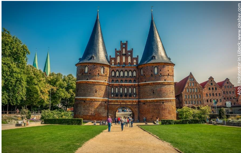
Abb.: Holstentor in Lübeck

Moderne Hansestädte mit dem großen H im Autokennzeichen und stolzem Beinamen im Ortsmarketing gibt es längst nicht mehr nur an Nord- und Ostsee. Tatsächlich umspannte der hansische Handel einen Wirtschaftsraum in Nordeuropa, der sich von London und Brügge bis Nowgorod, von Bergen bis zu den Frankfurter Messen erstreckte. Und das über zahlreiche territoriale, heute nationale Grenzen hinweg. Was band diesen Raum zusammen? Wie schafften die Hansen die Integration der vielen regionalen Märkte in einen gemeinsamen Wirtschaftsraum? Das sind Fragen, die in den Köpfen rasch viele aktuelle Parallelen wachrufen. Und sicher auch manchen Wunschtraum. Dem wollen wir gemeinsam nachgehen.