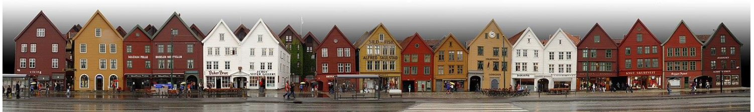
Abb.: Die Deutsche Brücke (Bryggen) Handelskontor in Bergen