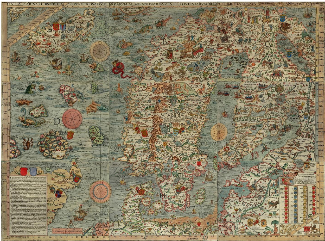
Abb.: Carta Marina